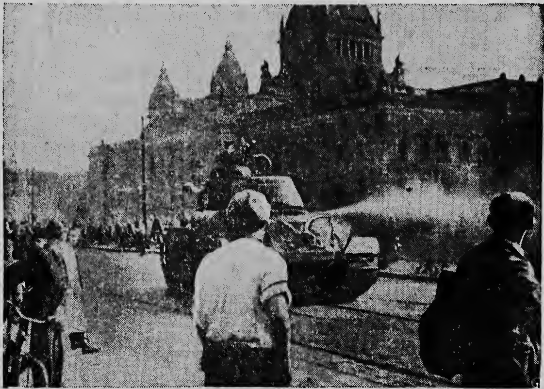
RODE TANKS raasden door de Oostduitse steden, waar het vorige maand tot ernstige ongeregelheden kwamen en waar het ondanks de krasse maatregelen der communisten nog steeds niet helemaal rustig is.